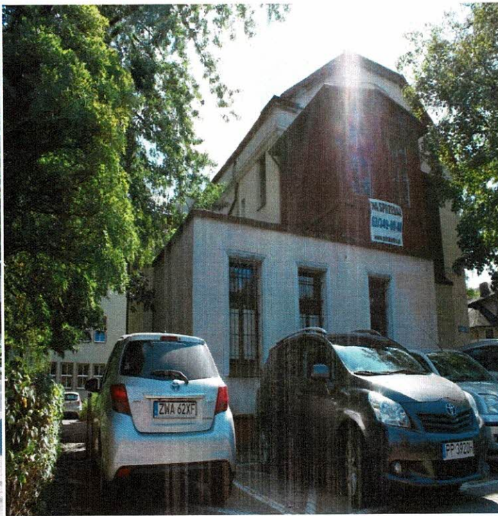
ELEWACJA BOCZNA WEJŚCIOWA